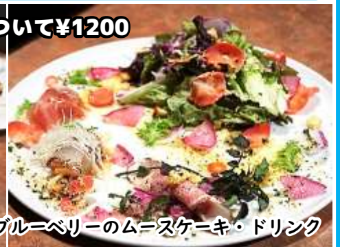
写真のメニュー... 魚介のペスカトーレ (ロツツ) ・前菜&サラダ・自家製フォカッチャ・ブルーベリーのムースケーキ・ドリンク