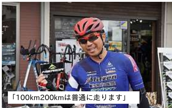
「100km200kmは普通に走ります」

令和の大嘗祭から1年。高根沢 で育てられたお米「とちぎの星」が 献上され、大嘗祭・大嘗宮の儀で は高根沢の風土をイメージした「稲 春歌」が詠まれました。この名誉を 後世まで伝える記念碑が完成し、 お披露目されました。 設置場所は、高根沢の広大な田 園風景が見渡せる素晴らしい眺望 元気あつぷむらの本館西側駐車場 温泉スタンド付近に建立されまし た。 石碑には、稲春歌が記されてい るほか、歌碑の由来も読むことが できます。