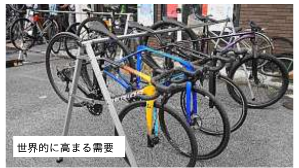
世界的に高まる需要