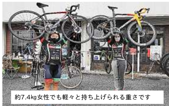
約7.4kg女性でも軽々と持ち上げられる重さです