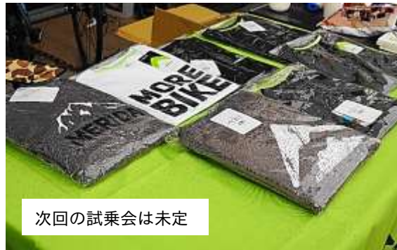
次回の試乗会は未定