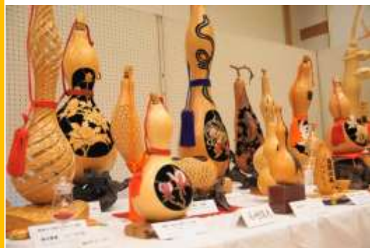
ご自身の作品の展示も