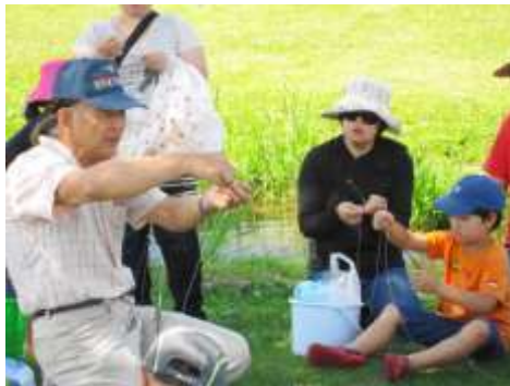
ザリガニ釣り体験の講師