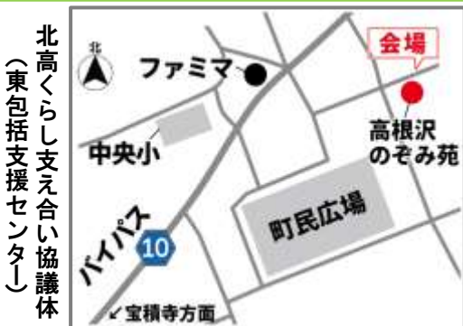
北高くらし支え合い協議体(東包括支援センター)