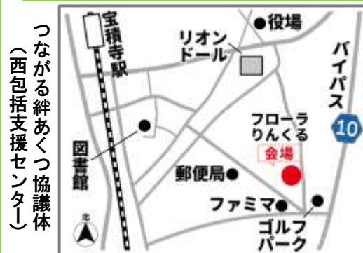
つながる絆あつくつ協議体(西包括支援センター)