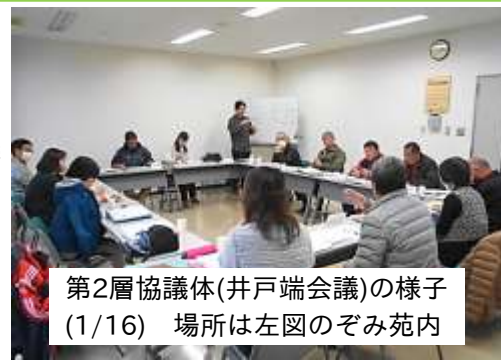
第2層協議体(井戸端会議)の様子(1/16) 場所は左図のぞみ苑内